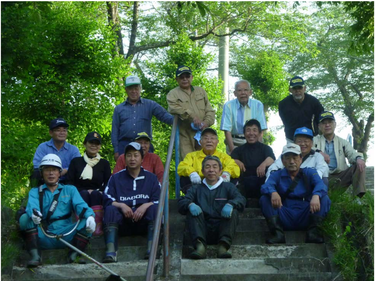
新緑に朝日が差し込み、清々しさが一段と増します。ダイナミックなオーケストラの調べは「奉仕」